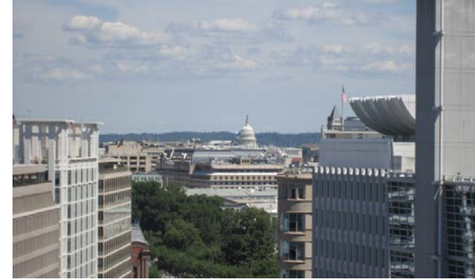
国際通貨基金本部第2ビルからの眺め